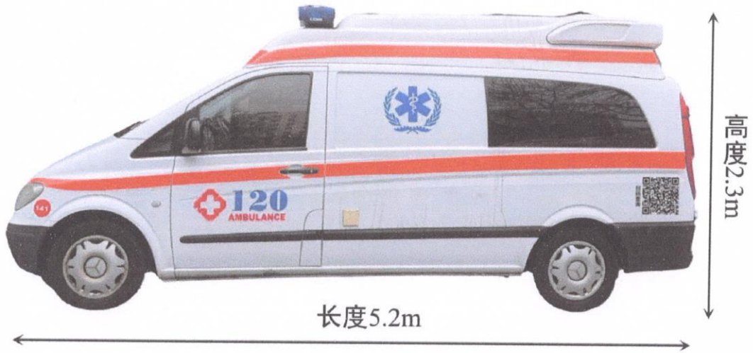
图 1 车身左侧喷涂效果