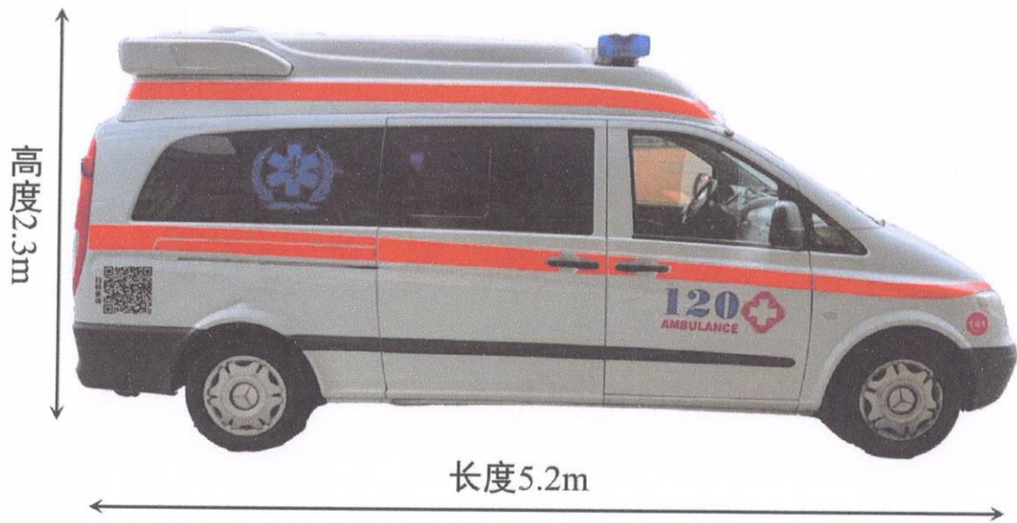
图 2 车身右侧喷涂效果